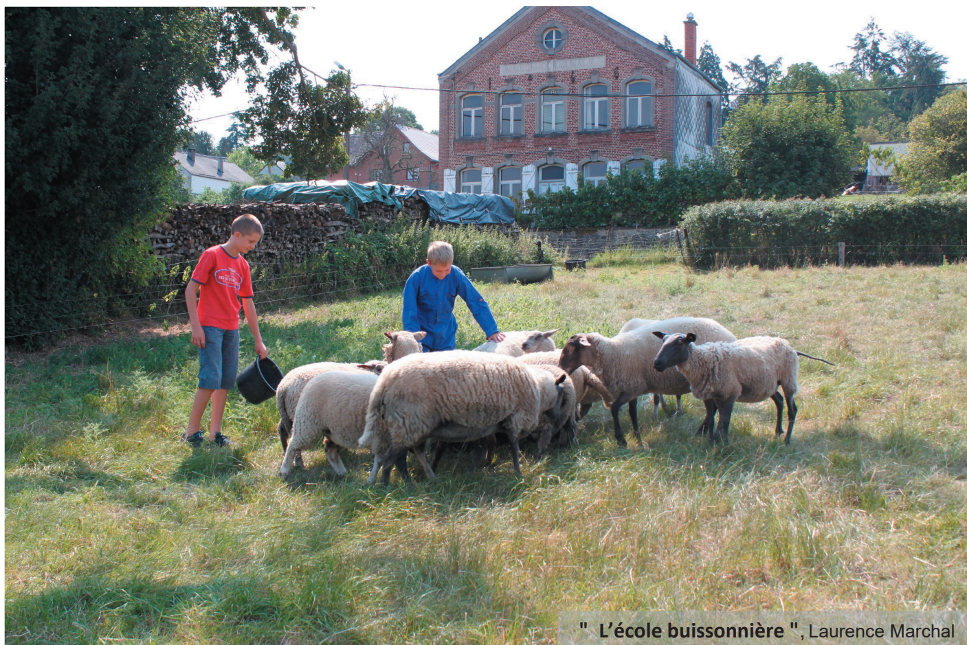
" L'école buissonnière ", Laurence Marchal

Voici une des photos " coups de cœur " de cette expo.